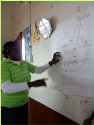
Uitleg CHE programma