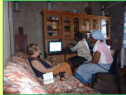
Trainers leren elkaar met DVD te werken