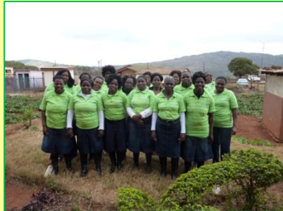
Home Based Carers Khakhu