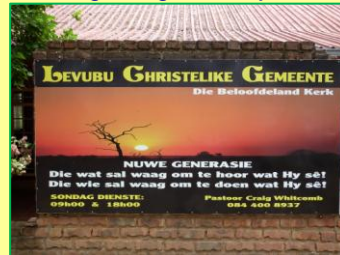
Overnachten in Levubu