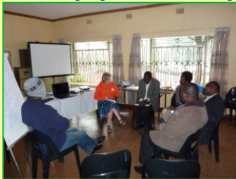
Visieseminar op Iyani Bijbelschool

Op www.strongroots.nl is de Blog te lezen met foto's erbij. We danken onze Vader voor hen die door meedenken, bemoediging, financiën en gebed ons werk en deze reis hebben meegedragen! Wil je ook mee gaan doen? Klik dan hier .