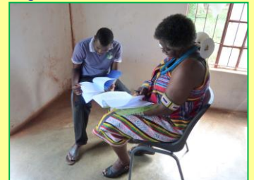
Tijdens training in Mukula