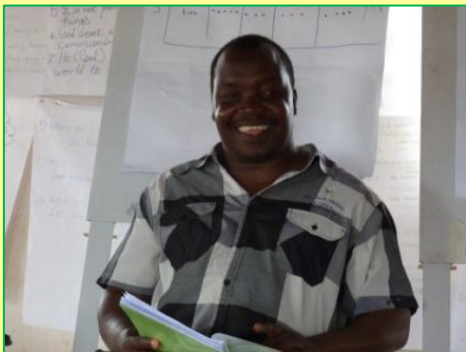
Een van de deelnemers

► Een CHE Training van Trainers (ToT) is ontworpen om trainers te trainen, die in hun eigen gemeenschap mensen trainen om CHE te implementeren. Zie voor bijzonderheden over deze training hier en op de website van CHE .