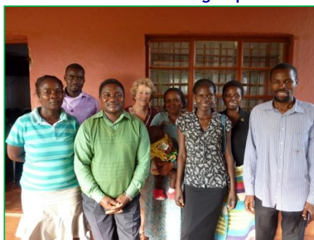
De Mukula trainersgroep met hun twee voorgangers

18 september – Huisbezoeken met de trainers van de Mukula groep.